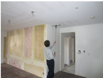
Fig.1 Construction states photograph of a chemical sorbent coating.

小形チャンバー試験の結果、吸着速度： 18.4(\mu\text{g}/(\text{m}^2 \cdot \text{h})) 、換算換気量： 0.74(\text{m}^3/(\text{m}^2 \cdot \text{h})) であった。GRAFTON 社製吸着材は試料負荷率と相当換気回数が直線関係で近似できることから、機械換気回数 0.5(\text{h}) の半分に相当する換気回数 0.25(\text{h}) を確保するために必要な試料負荷率を 0.35(\text{m}^2/\text{m}^3) とした。試料負荷率 0.35(\text{m}^2/\text{m}^3) での面積確保は天井のみの施工で可能であることから施工箇所を天井のみとした。このときの吸着剤塗布量は 100\text{g}/\text{m}^2 とした。